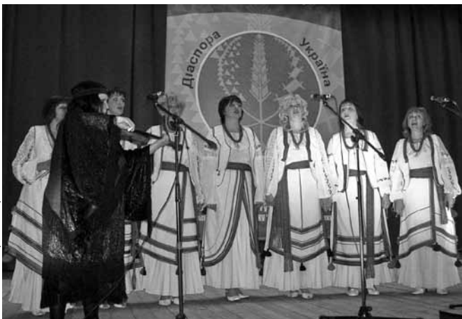
☐ Виступає ансамбль „Відлуння“ з Таллінна