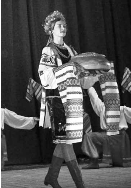
☐ Ансамбль „Вірність“ хлібом-сіллю вітає учасників свята

У кожного з нас є місце, куди можемо приходити з радістю і смутком, з клопотами і здобутками, з поразками і перемогами. Кожен має своє неповторне пристанище, де нас зрозуміють і приймуть такими, якими ми є. Для нас, українців, тим особливим місцем є Україна. Вона нагадує про наше коріння, родовід, сім'ю, з якої ми вийшли, домівку, з якої ступили перші кроки в самостійне життя.