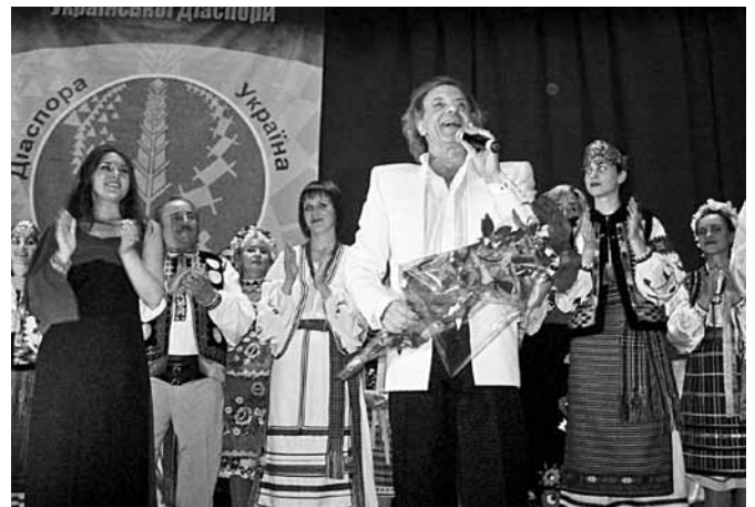
☐ Музичний дарунок від легенди української естради Василя Зінкевича