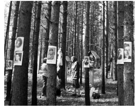
Портрети представників української еліти та духовенства ХХ ст., розстріляних у жовтні — листопаді 1937