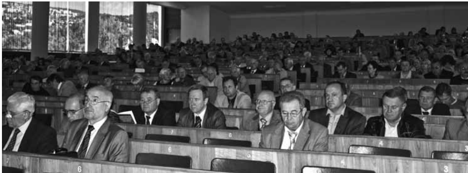
→ Закінчення. Початок на 3 с.

Юрій Ярославович пишається, що Міністерство освіти й науки відзначило роботу студентського самоврядування Львівської політехніки як приклад для всієї України.