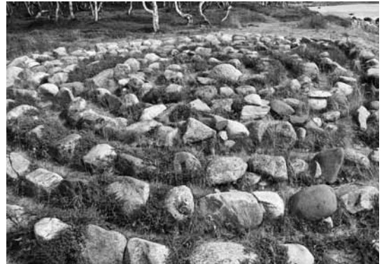
Походження соловецьких лабіринтів — загадка для вчених

Добре було б, якби ГУЛАГівська історія стала своєрідним щепленням проти тиранії, якби вона навчила нас