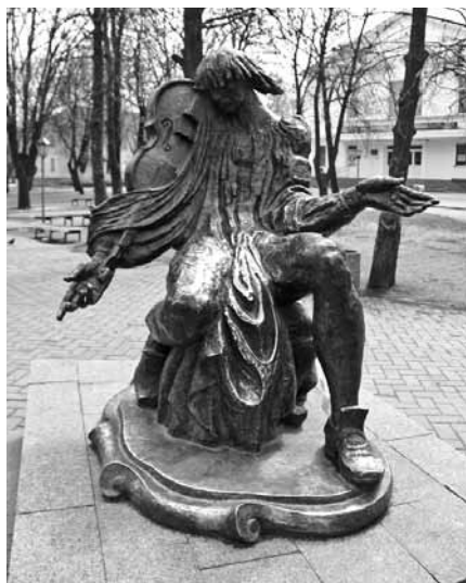
[•] Пам'ятник М. Березовському в Глухові

Італія. Один із європейських центрів музичної освіти — Болонська філармонічна академія. Саме тут наш земляк приблизно вісім років навчається у відомого історика й теоретика музики, яскравого представника музичної